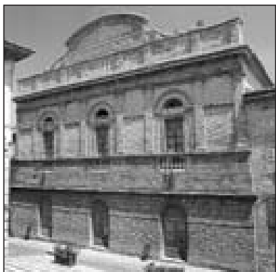
MONTERUBBIANO TEATRO "V. PAGANI"